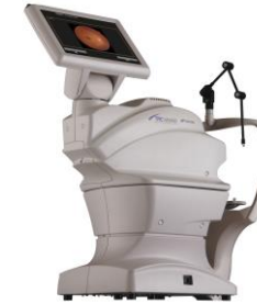
Funduskamera (Gerät I.)

Wir setzen bei der Analyse des Augenhintergrundes auch auf die künstliche Intelligenz. Diese hilft Unregelmässigkeiten auf der Netzhaut frühzeitig zu erkennen. Bei Auffälligkeiten stellen wir den Kontakt zum Augenarzt her.